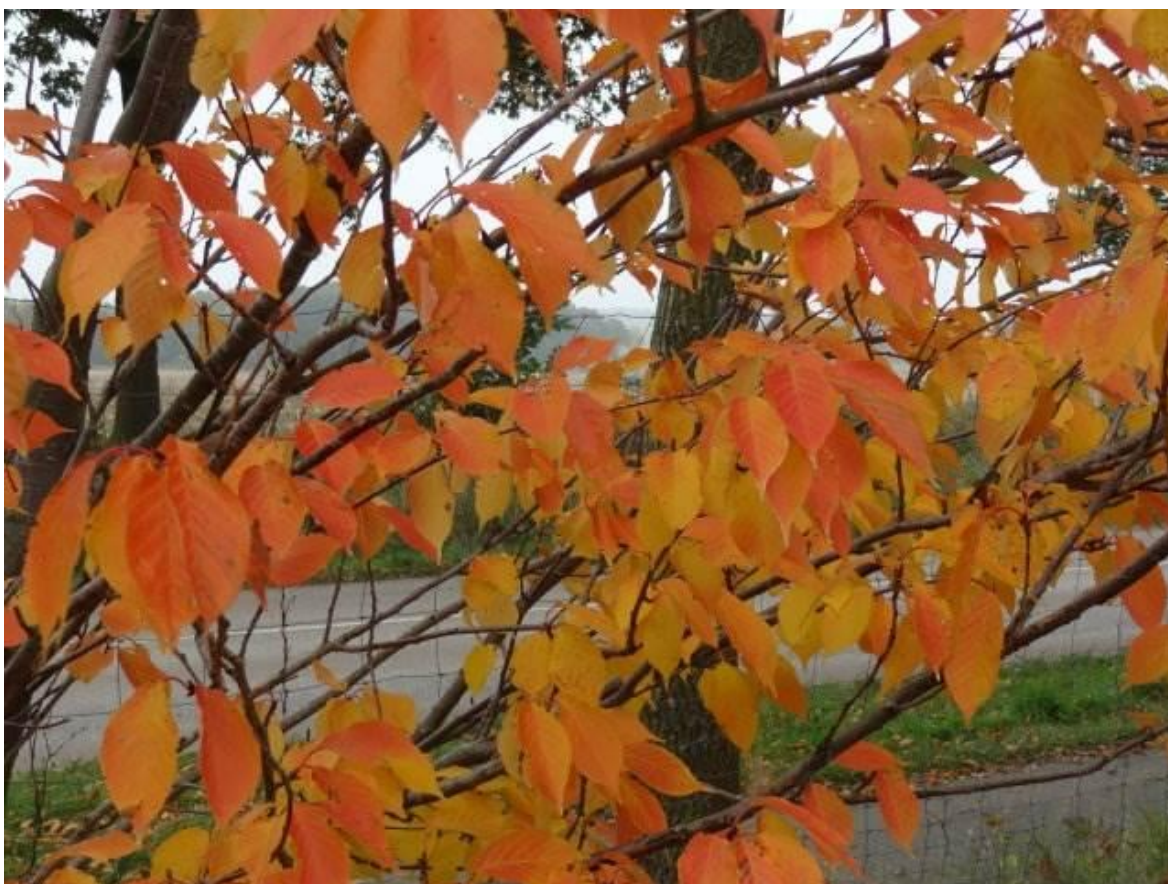
Prunus yedoensis – podzimní vybarvení listů