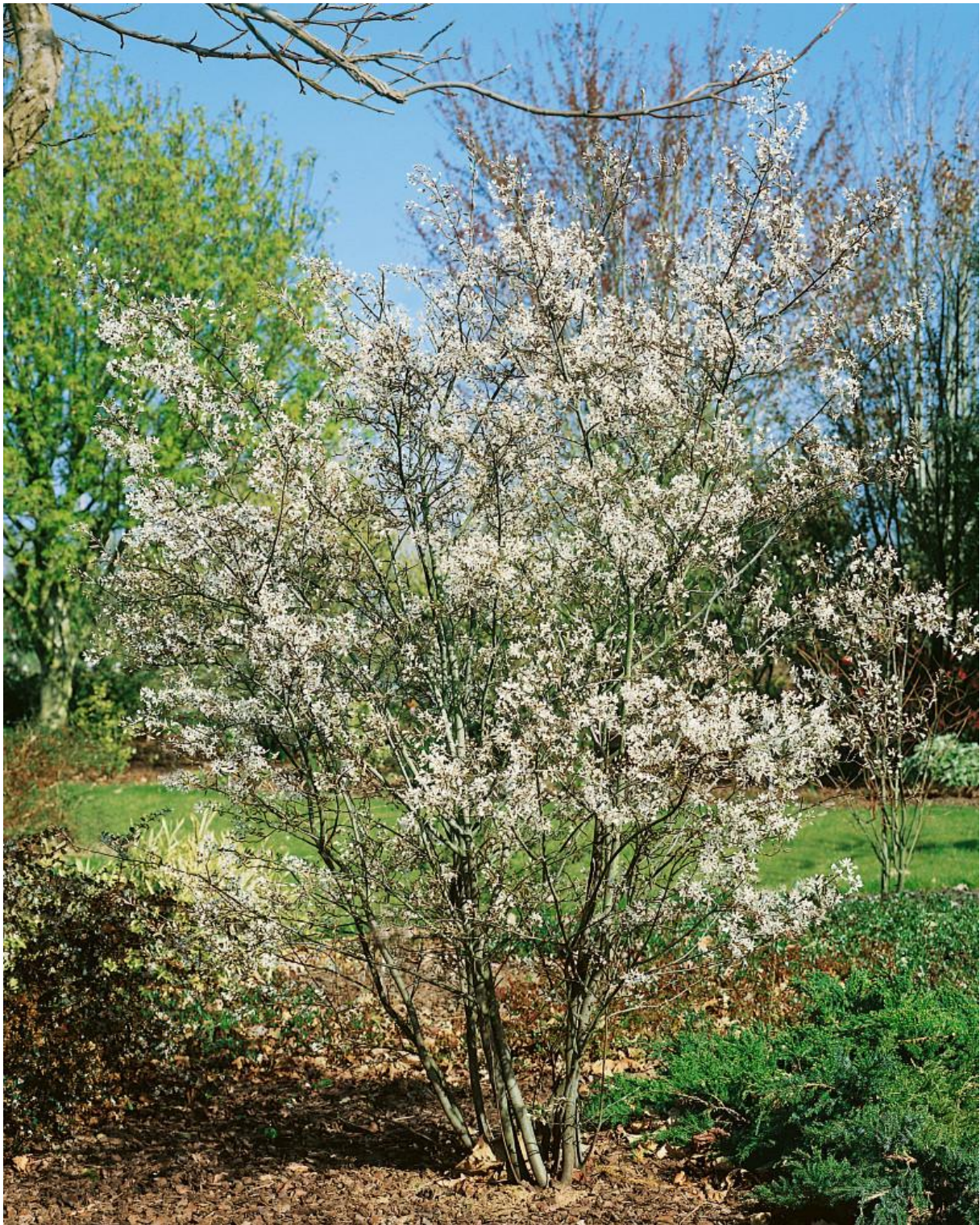
Amelanchier lamarckii, vicekmen