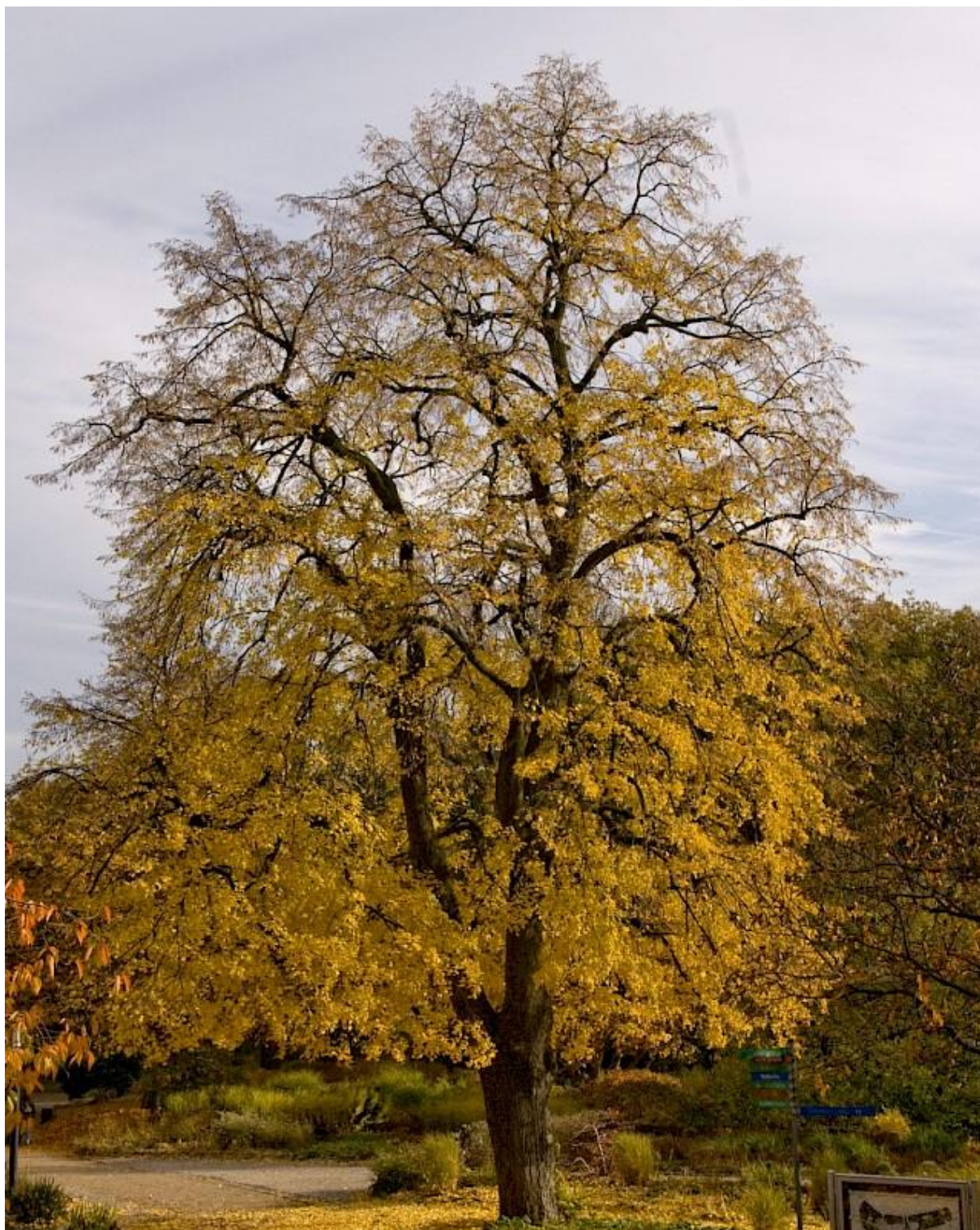
Tilia euchlora – doplnění do uličního lipového stromořadí